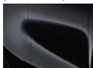
Black Pearl (1K – Metallic)