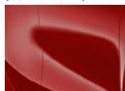
Track Red (FRD – Solid)