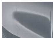
Lunar Silver (CSS – Metallic)