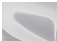
Deluxe White (HW2 – Metallic)