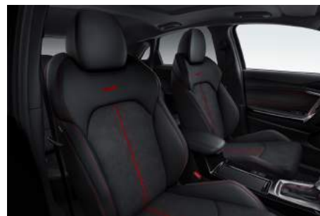
Rivestimento sedili in pelle (Suede) con logo GT