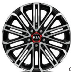
Cerchi in lega leggera da 18"