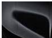
Black Pearl (1K – Metallic)