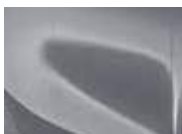
Lunar Silver (CSS – Metallic)