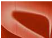
Orange Fusion (RNG – Metallic)