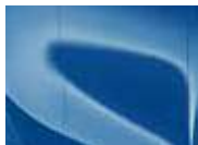
Blue Flame (B3L – Metallic)