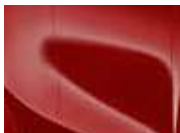
Track Red (FRD – Solid)