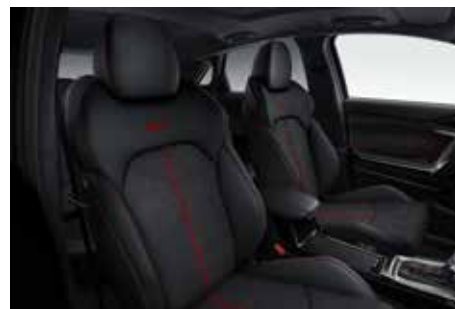
Rivestimento sedili in pelle (Suede) con logo GT