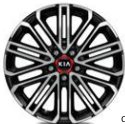
Cerchi in lega leggera da 18"