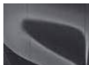
Penta Metal (H8G – Metallic)