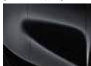
Black Pearl (1K – Metallic)