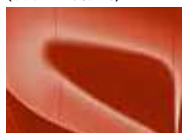
Orange Fusion (RNG – Metallic)