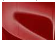
Track Red (FRD – Solid)