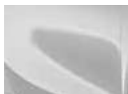
Deluxe White (HW2 – Metallic)