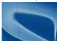
Blue Flame (B3L – Metallic)