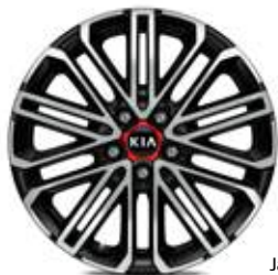
Jantes en alliage léger 18"