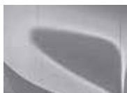
Sparkling Silver (KCS – Metallic)