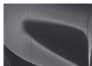
Penta Metal (H8G – Metallic)