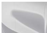
Deluxe White (HW2 – Metallic)