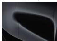
Black Pearl (1K – Metallic)