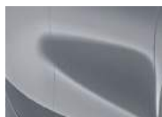
Lunar Silver (CSS – Metallic)