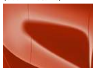
Orange Fusion (RNG – Metallic)