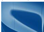
Blue Flame (B3L – Metallic)