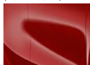
Track Red (FRD – Solid)