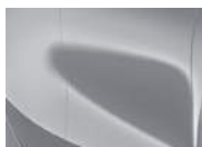
Sparkling Silver (KCS – Metallic)