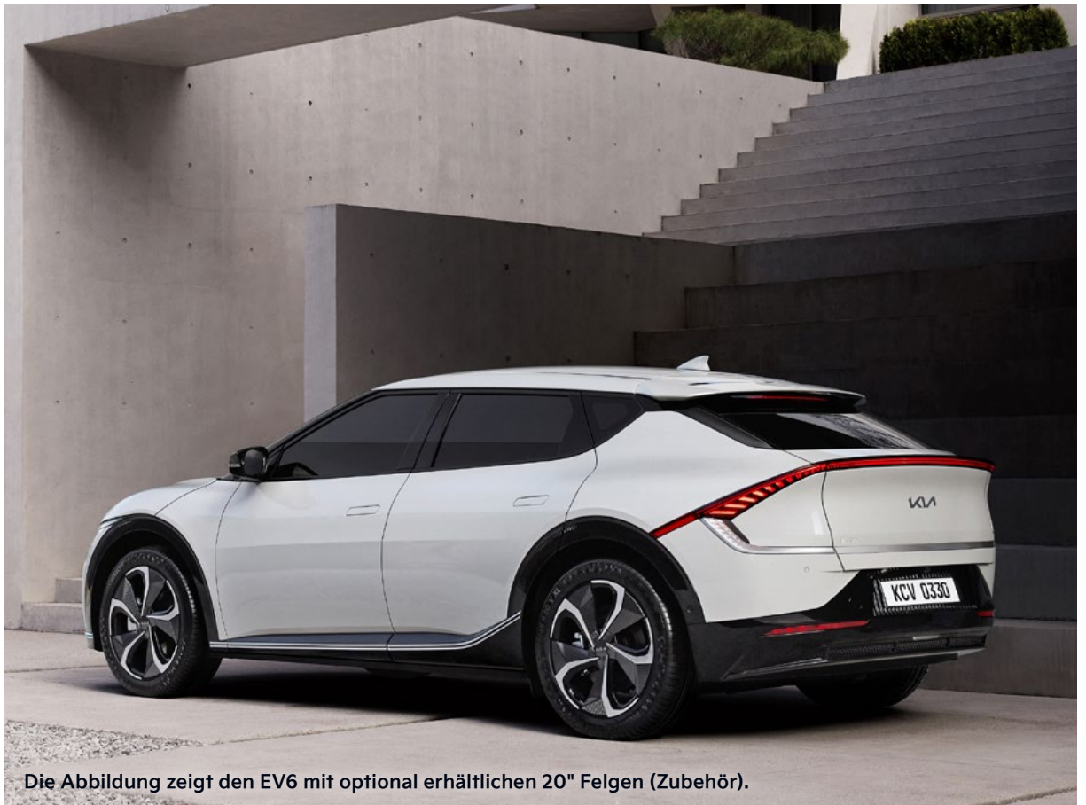
Die Abbildung zeigt den EV6 mit optional erhältlichen 20" Felgen (Zubehör).