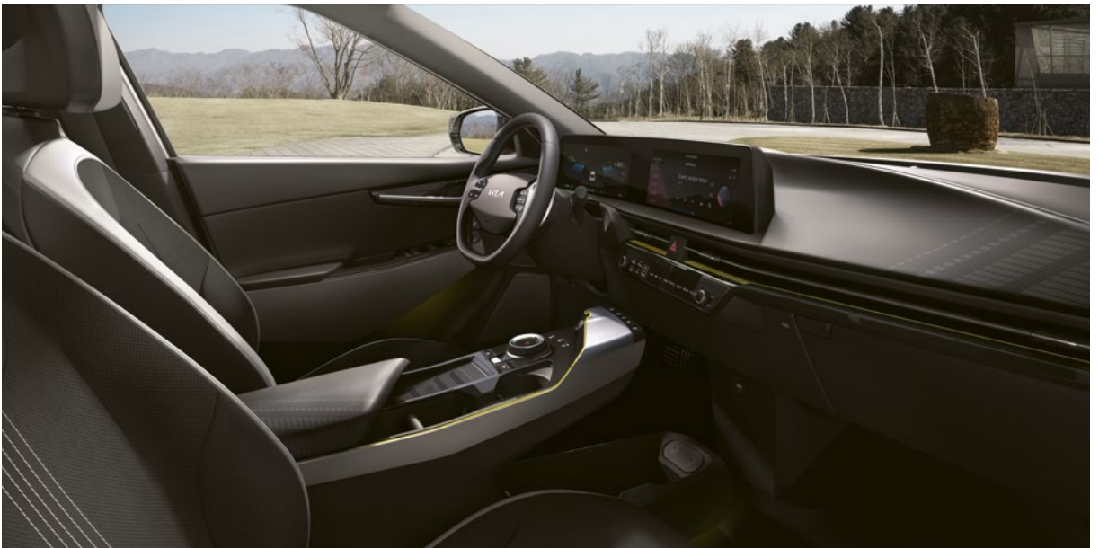
Interieur GT-Line Black