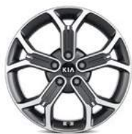
18" Leichtmetallfelgen (Zubehör)