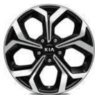
17" Leichtmetallfelgen (Zubehör)