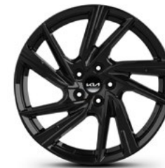
2 jante alu 19"