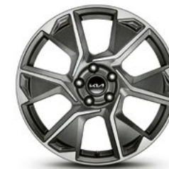
1 jante alu 19"