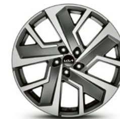
3 jante alu 20"