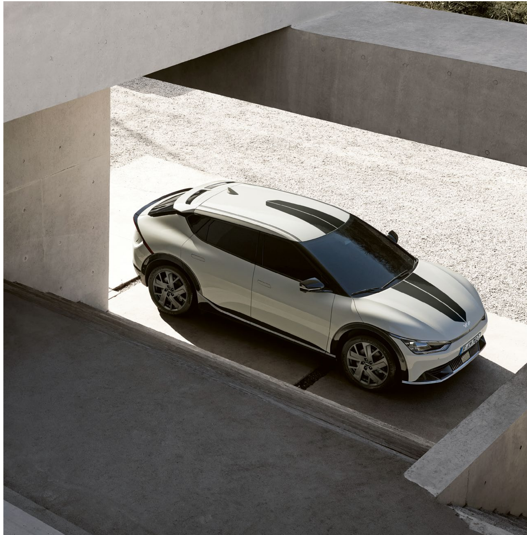
Bandes adhésives, noir brillant

Bandes adhésives. Donnez une touche sportive supplémentaire à votre véhicule et renforcez la sensation de vitesse grâce à ces lignes élégantes et aérodynamiques.