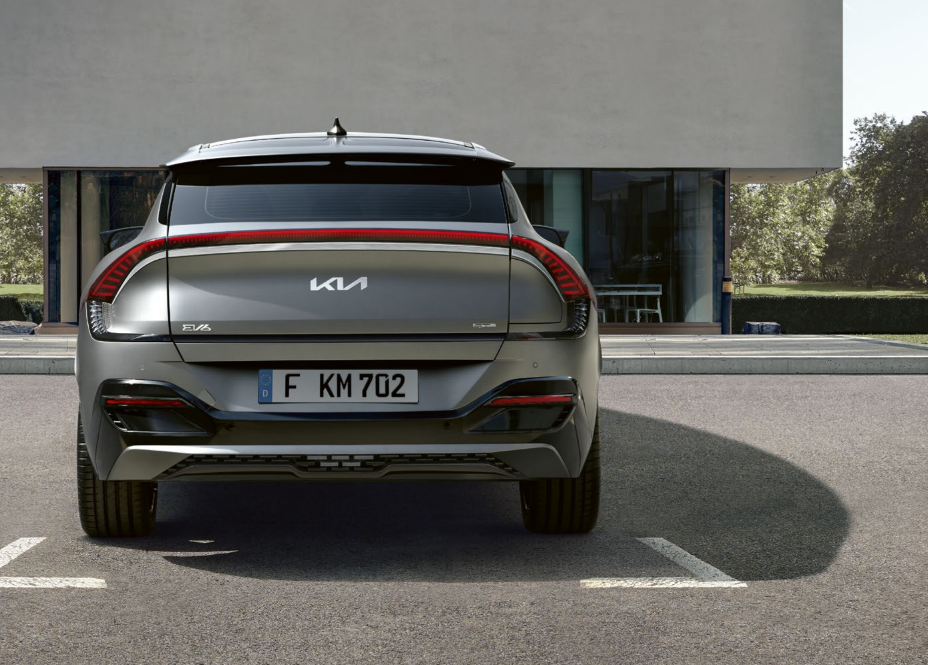
Finition aluminium satiné