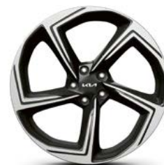
4 jante alu 21"