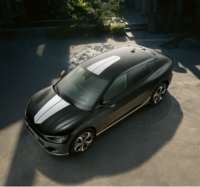
Bandes adhésives, blanc mat