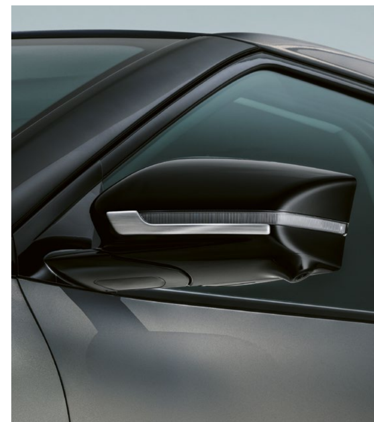
Finition aluminium satiné